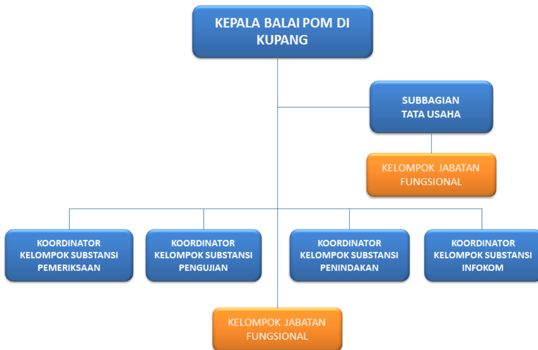
Gambar 1.2 Struktur Organisasi Balai POM di Kupang

Struktur Organisasi dan Tata Kerja Balai POM di Kupang diatur dalam Peraturan Badan Pengawas Obat dan Makanan No 23 Tahun 2021 tentang Perubahan atas Peraturan Badan Pengawas Obat dan Makanan Nomor 22 Tahun 2020 Tentang Organisasi dan Tata Kerja Unit Pelaksana Teknis di Lingkungan Badan Pengawas Obat dan Makanan. Berikut adalah Struktur organisasi Balai POM di Kupang seperti pada gambar 1.2