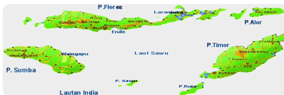
Gambar 1.1 Peta Wilayah Provinsi Nusa Tenggara Timur

Cakupan pengawasan Balai POM di Kupang tersebar di wilayah kerja Provinsi Nusa Tenggara Timur yang terdiri atas 15 Kabupaten dan 1 Kota terhadap 192 sarana produksi pangan MD, IRTP, dan U MOT serta 2.406 sarana distribusi obat dan makanan. Kabupaten/kota ini tersebar di 7 pulau utama: Sumba (Sumba Barat, Sumba Timur, Sumba Barat Daya, dan Sumba Tengah), Timor (Kota Kupang, Timor Tengah Selatan, Timor Tengah Utara, Belu, Kabupaten Kupang, Malaka), Flores (Sikka, Flores Timur), Alor (Alor), Lembata (Lembata), Rote (Rote Ndao), dan Sabu (Sabu Raijua).